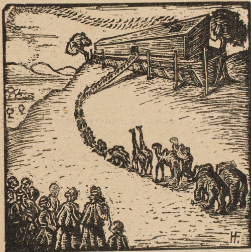
„Je zu Zweien kamen sie zu Noah in die Arche“ (1. Buch Moses 7,1)

Besondere Aufmerksamkeit verdienen seine Bibelillustrationen.*) Sie sind wie die Sprache der Bibel selbst. Markant, flächig gehalten und fast ergreifend in ihrer wuchtigen Naivität. In diesen Blättern liegt nichts Begrabenes, sondern etwas Lebendiges, Gegenwärtiges. Welch gut gelungener Ausdruck liegt z. B. in dem Kopf des aus der Arche spähenden Noah!